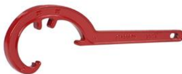
Demonteringsnøkkel for Serie1 PushFit PP - Hurtigkoblinger